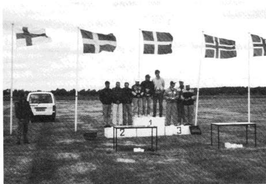
De tre beste lagene fv. Dk, S, SF, som man ser vaiet flaggene godt i vinden.