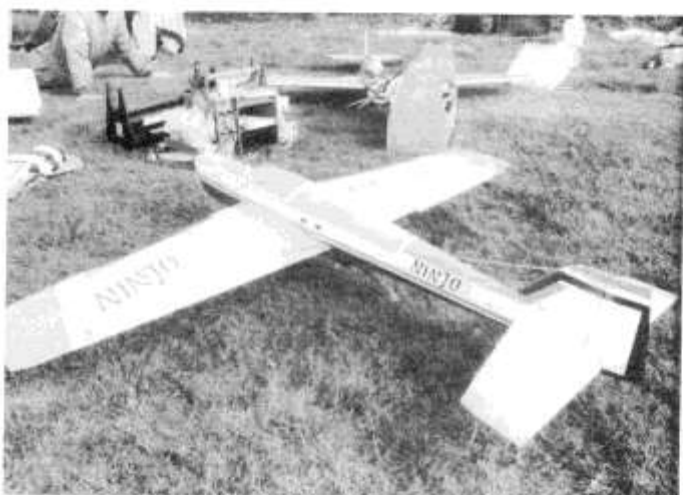
Dette er modellen til Topani Kippo fra Finland. Modellen er konstruert og bygget av han selv.