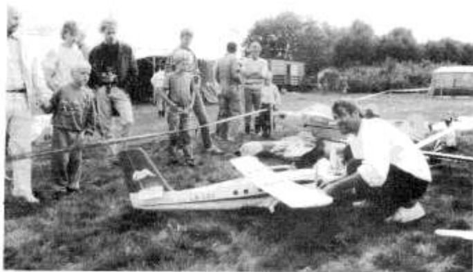
Modelflyklubben Vingen holdt oppvisning i pausen. Her var det mange fine modeller å se.