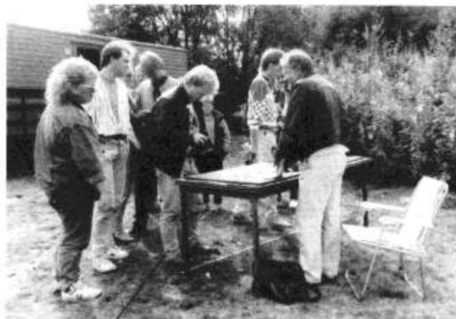
Lørdag og søndag var det en jevn tilstrømming av tilskuere.

Samtlige av påmeldte deltakere møtte frem. I alt 19 flygere fordelt på 6 juniorer og 13 seniorer. På et slikt betydningsfullt stevne er det viktig å ha mange dommere. Hvert land hadde med seg sin egen dommer og med en ekstra fra Norge, ble det til sammen fem. Høyeste/laveste poeng ble så strøket fra dette dommerpanelet. Dette er med på å gjøre bedømmelsen mest mulig rettfærdig.