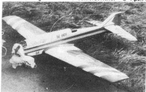
Over: Benny Kjellgrens Super Curare.

ek-egen konstruksjon mod-modifisert av flygeren L-Landslagsdeltaker J-Juniordeltaker O-Åpen deltaker