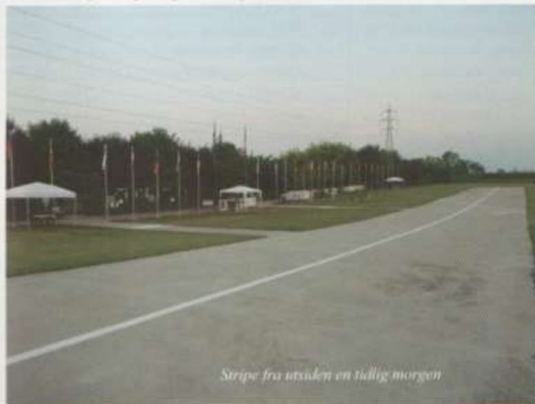
Stripe fra utsiden en tidlig morgen